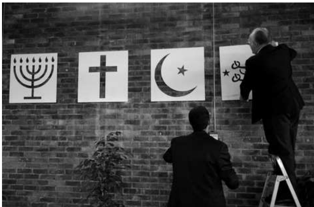
Prière interreligieuse pour les vingt ans de la première rencontre d'Assise, organisée au Centre Huit par le Groupe interreligieux pour la Paix 78, le 12 novembre 2006, à Versailles (78).

Benoît XVI se rendra le 27 octobre à Assise pour célébrer le 25 e anniversaire de la rencontre interreligieuse pour la paix.